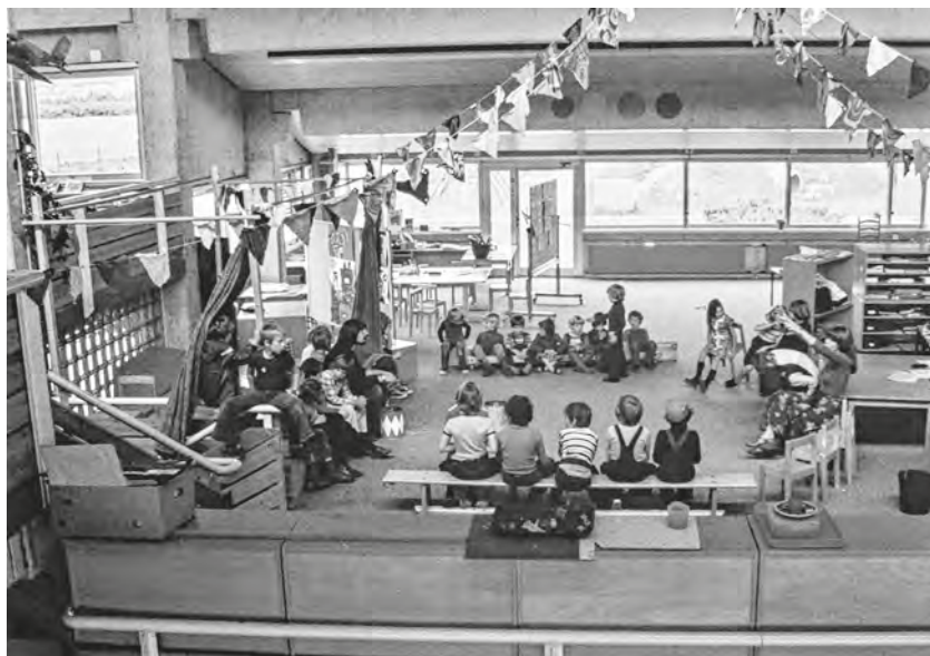
Abb. 1: Flächenversammlung im Haus 1 der Laborschule im Sommer 1977.