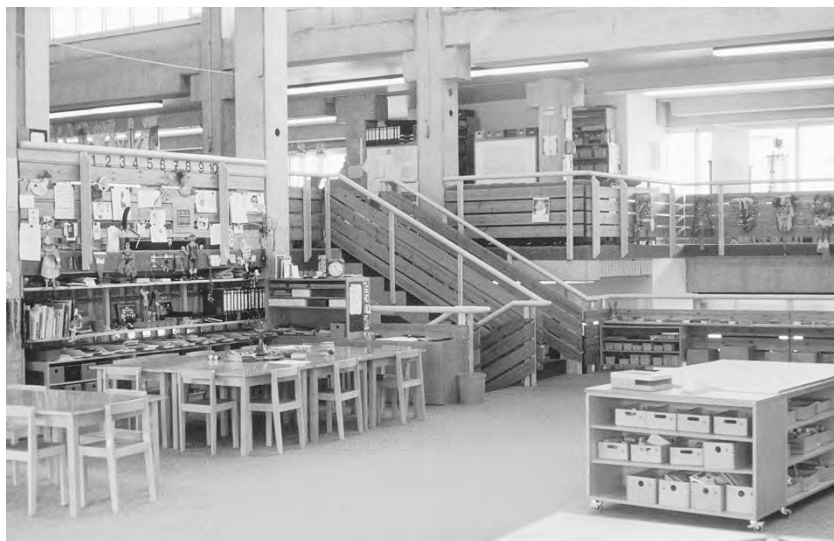
Abb. 2: Das Haus 1 und sein Mobiliar Ende der 1970er Jahre.

Wochen für sich entdeckt und waren glücklich damit. Wir waren es nicht. Es kostete pädagogische Kraft, sie an einem Ort zu halten, „oben“ ging es besser, weil der Ort gerahmt war vom Geländer und den Fenstern. Zwar wollten wir nach wie vor die Kinder flexibel und frei und so weiter sein lassen, aber sich etwas zum Spielen oder Arbeiten vornehmen sollten sie eben auch. Dies zu erreichen war nach den wunderlichen ersten Wochen eine hohe Aufgabe für uns Erwachsene.