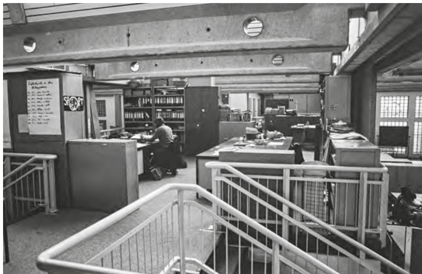
Abb. 1: Lehrer*innen-Arbeitsplatz auf einem Wich der Laborschule im Frühjahr 1978.

Pulk, als Sowis. Und die haben sich von Anfang an immer auch als Gruppe verstanden. Das war mit den Mathematikern anders, da waren die Leute mehr einzeln für sich.