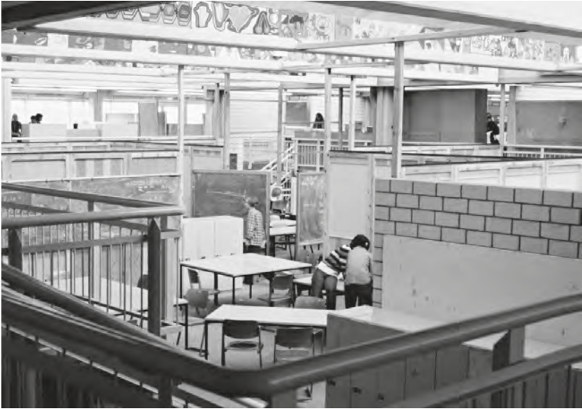
Abb. 1: Der Großraum der Laborschule im Frühjahr 1979.