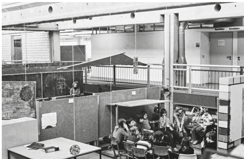
Abb. 1: Abgeschirmte Gruppenbereiche im Großraum der Laborschule im Frühjahr 1979.

als die Vorführung von Filmen und Tondokumenten so gut wie ausgeschlossen war. Die Akustik war höchst problematisch und führte dazu, dass sich Nachbargruppen abgelenkt und gestört fühlten. Wenn der Stundenplan es wollte, waren gleichzeitig vier Gruppen auf einem Feld und im Extremfall noch zwei Gruppen auf dem benachbarten „Wich“! Das war zum Glück nur selten der Fall. Die Offenheit sorgte andererseits dafür, dass der traditionelle lehrerzentrierte Unterricht nicht praktiziert werden konnte. Zwangsläufig, denn jede laute Stimme war auf dem gesamten Feld zu hören und störte die Konzentration in den Nachbargruppen.