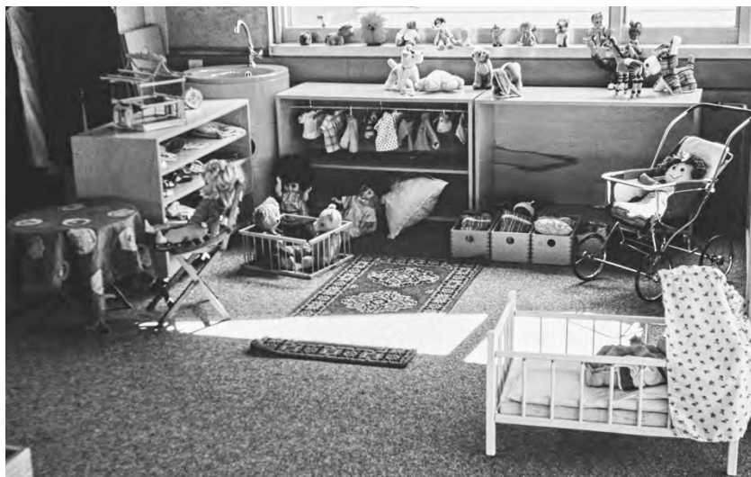
Abb. 2: Puppenecke im Haus 1 der 1970er Jahre. Foto: unbekannt; Quelle: Universitätsarchiv Bielefeld, FOS 04824.

Und eigentlich brauchten wir alle Zeit für die Entwicklung unserer eigenen Pädagogik, so dass wir uns zunehmend gegenseitig in Ruhe ließen und uns erstmal machen ließen. Ich erinnere mich, dass ich natürlich viel sah, wenn ich durchs Haus ging, auch Befremdliches, dass ich aber darüber kein kritisches Wort verlor, was eigentlich außerhalb meines eigenen Teams meine ganze Laborschulzeit über so geblieben ist – wohl insgesamt eine verständliche, aber auch irritierende Reaktion auf den Großraum, der ja genau dies ermöglichen sollte.