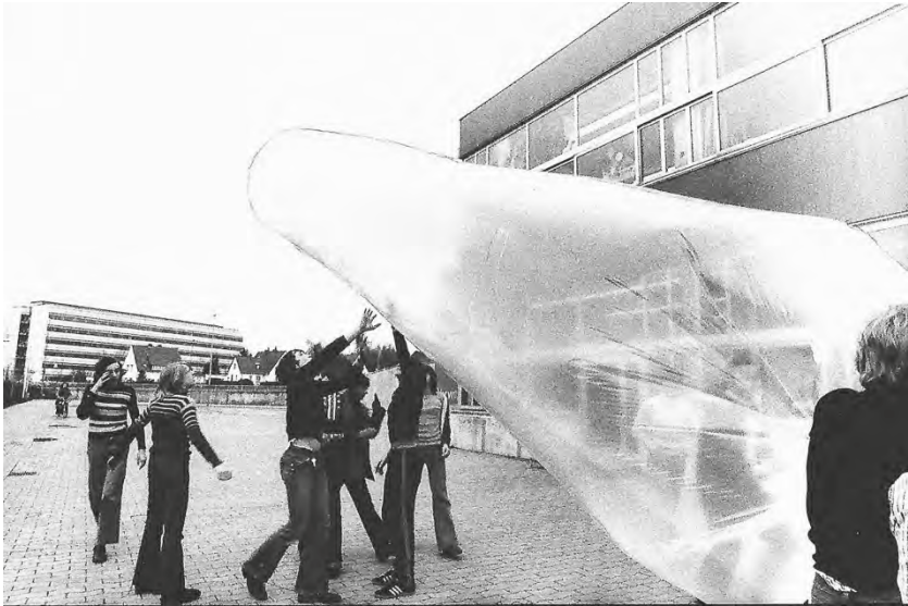
Abb. 2: Ballonflug-Projekt auf dem Gelände der Laborschule.

In welchem Rahmen fanden diese Unterrichtsvorhaben denn statt? Handelte es sich dabei um ein Wahlangebot, um Fachunterricht oder um einen Bestandteil Ihrer Arbeit als Stammgruppenlehrer?