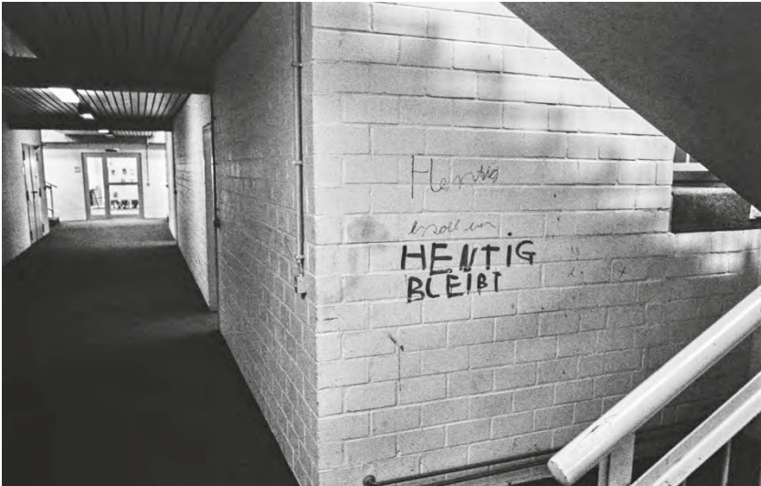
Abb. 3: Graffiti im Flurbereich der Laborschule im Frühjahr 1978.

te im Schulalltag aber so gut wie keine Rolle. Hinzu kam, dass er aufgrund seiner nationalen und internationalen Bekanntheit ein gefragter Mann und dementsprechend viel unterwegs war. Für eine regelmäßige Teilnahme an Lehrerkonferenzen beispielsweise oder informelle Gespräche in Pausen bzw. nach Unterrichtsende fehlte ihm die Zeit. Ich fand es allerdings erstaunlich, dass er trotz großer Inanspruchnahme darauf Wert legte zu unterrichten, und dass er sehr darauf geachtet hat, seinen Latein-Unterricht möglichst regelmäßig stattfinden zu lassen.