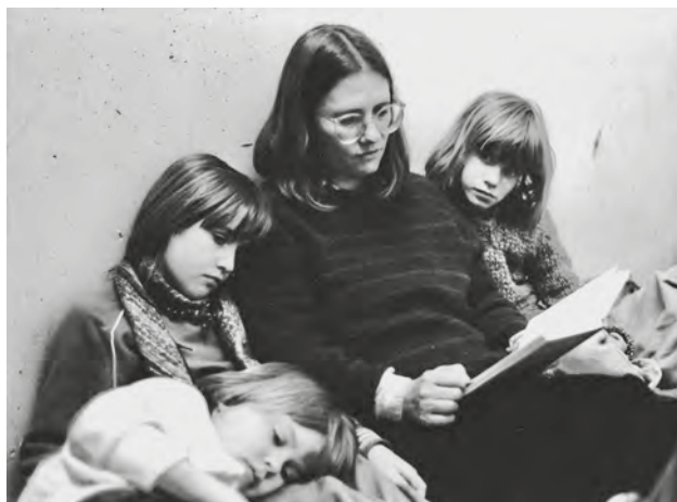
Abb. 4: Lese-Versammlung im Treppenturm des Oberstufen-Kollegs Anfang der 1980er Jahre.