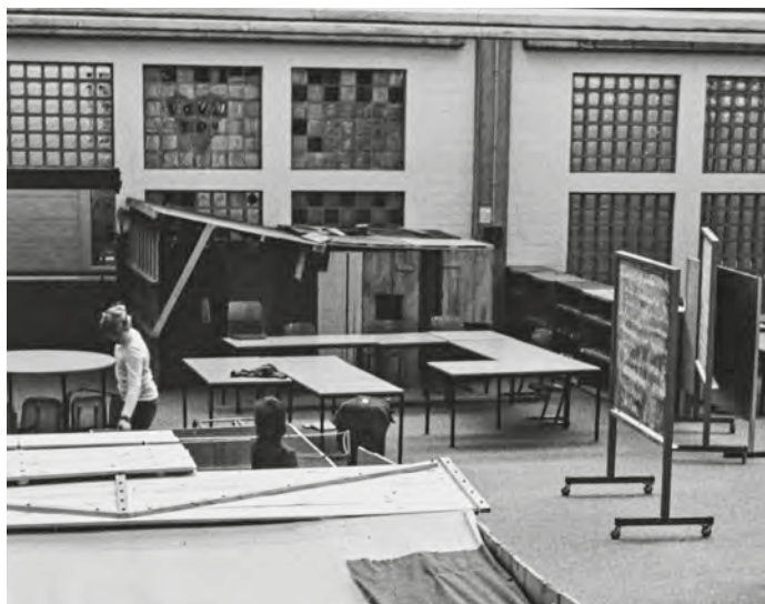
Abb. 1: Buden im Großraum der Laborschule Mitte der 1970er Jahre.