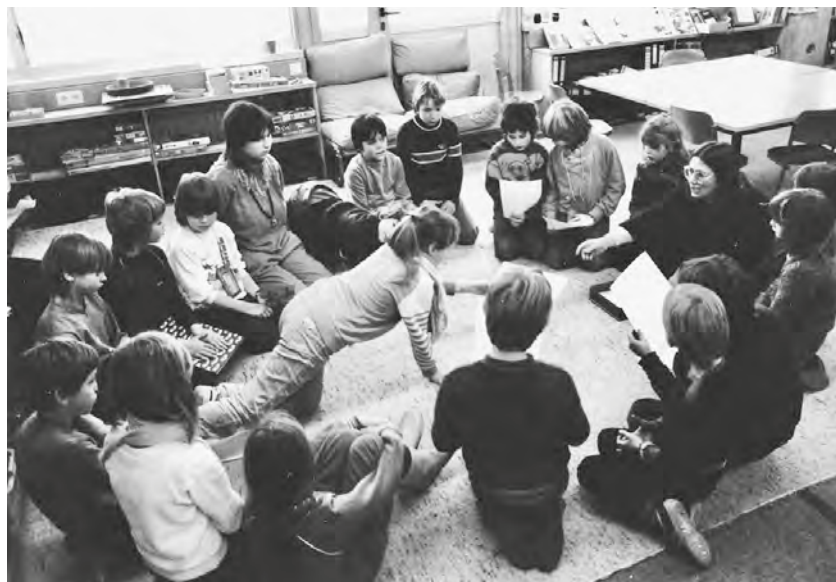
Abb. 3: Arbeitsbesprechung Anfang der 1980er Jahre.

Nein, für die Versammlung, so wie ich sie 1989 in „Erfundene Geschichten ...“ mit dem Untertitel „Lesen und Leben in der Schule“ 7 beschrieben habe, hatte ich keine Vorbilder.