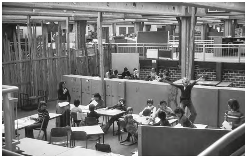
Abb. 2: Palisaden im Großraum der Laborschule im Sommer 1977.

unvollständig, vielleicht auch etwas vorschnell. Wie wäre es ausgefallen, wenn er die zu diesem Zeitpunkt wohlgeordnete Eingangsstufe vor Augen gehabt hätte? Oder die Bibliothek? Oder die Werkstatt? Könnte es nicht sein, dass die Schularchitekten ein verdrehtes Bild davon hatten, wie eine offene Versuchsschule aussehen soll, dass dieser Riesenraum pädagogisch einfach nicht zu füllen war? Oder dass es für die Schülerinnen und Schüler keine allgemeinen Vereinbarungen zur Nutzung des Großraumes gab, keine verbindliche Einführung, kein Reglement? Die Besuchergruppe diskutiert lebhaft. Ich rücke mit meiner Meinung nicht raus aber ich denke im Stillen: Wenn man eine Schule so einrichtet, so präsentiert und so betreut, dass die Schülerinnen und Schüler denken müssen, es handle sich hier um einen besonders attraktiv ausgestatteten, dazu überdachten Abenteuerspielplatz, dann muss man sich nicht wundern, wenn Kinder, die von der Laborschulpädagogik und ihrem Lernen wenig Ahnung haben, diesen schulischen Abenteuerspielplatz auch entsprechend nutzen: rasend, rennend, spielend, tobend. (Auch diesen Bewegungszwang beschreibt Hentig, s.o.)