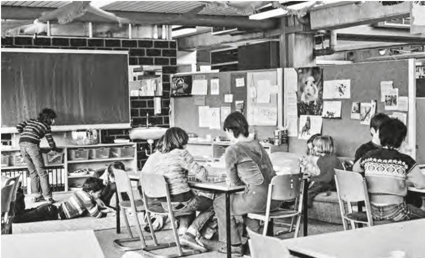
Abb. 4: Flexible Raumnutzung in einer Gruppe der Stufe II im Frühjahr 1979. Foto: unbekannt; Quelle: Universitätsarchiv Bielefeld, FOS 04940.

Prinzip der flexiblen Nutzung: In der Eingangsstufe gibt es neben Einzel- und Kleingruppentischen auch größere Tischflächen, die für gemeinsame Arbeiten der ganzen Stammgruppe gedacht sind. (In der Erstausstattung waren solche Möbel so nicht vorgesehen, die Laborschulwerkstatt produzierte auf Anfrage und Bitten hin entsprechende Arbeitsplatten.) In der Stufe II sind die Gruppen zu groß; sie können um solche Tischplatten herum nicht mehr platziert werden. Hier sind meist nur Einzeltische vorhanden, die nach Bedarf zusammengeschoben werden können. Es gibt keine Sitzordnungen (festen Arbeitspartnerschaften). Jede und jeder setzt sich, so wie sie und er das gerade will. Irgendwo dazwischen die Lehrerinnen und Lehrer. „Tischgruppenarbeit“, Formen von Partnerarbeit etc. werden erst langsam entwickelt (z. T. durch die Praxis anderer Gesamtschulen und durch andere Grundschulen inspiriert).