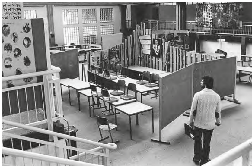
Abb. 1: Feld I der Laborschule (ca. 1977).

Wo und wie wurde die von Ihnen wahrgenommene „große Empathie zwischen Jung und Alt“ denn im Schulalltag unter anderem sichtbar? Oder anders gefragt: Wie müssen wir uns das Miteinander von Lehrer*innen und Schüler*innen in dieser ersten Zeit nach Eröffnung der Schule konkret vorstellen?