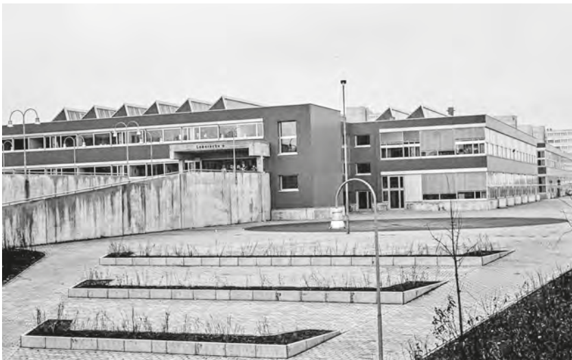
Abb. 3: Blick auf den Eingangsbereich der Laborschule Mitte der 1970er Jahre.

Ich empfehle den Besuchern, ihren „fremden Blick“ zu nutzen und Eindrücke zu sammeln. Zusammen genommen würden diese Eindrücke – wir setzen unseren „Gang durch das Gebäude“ jetzt fort – vielleicht ein Stück „Laborschulpädagogik“ sichtbar machen.