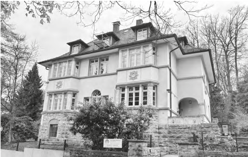
Abb. 1: Die ehemalige Villa der Aufbaukommission, fotografiert im Frühjahr 2024.

Dann zeigte er mir meinen zukünftigen Arbeitsplatz und wies mich in meine Aufgaben ein. Als Erstes musste ich eine Materialkartei über das Büromaterial anlegen und den Bestand eintragen. Für jeden Büroartikel sollte eine neue Karte mit Materialnummer angelegt werden. Jeder, der sich bei mir Büromaterial holte, musste von nun an unterschreiben, welche Artikel er sich abgeholt hat. Ich hatte zum Beispiel für jeden Bleistift – wir hatten drei verschiedene Sorten – eine Karteikarte anzulegen. Sie können es sich ja vorstellen. Ich hatte dann schnell über 200 Karteikarten – und wir hatten ja noch nicht viel Material, wirklich nur Kleinigkeiten. Für Bleistiftanspitzer, Hefter und Klammerhefter wurde eine so genannte Benutzernachweiskartei, eine BNK angefertigt: Das waren grüne Karteikarten, auf denen jeder Lehrer den Empfang bestätigen musste. Aus der BNK war dann auch genau ersichtlich, welche Kleingeräte jeder einzelne Mitarbeiter erhalten hatte.