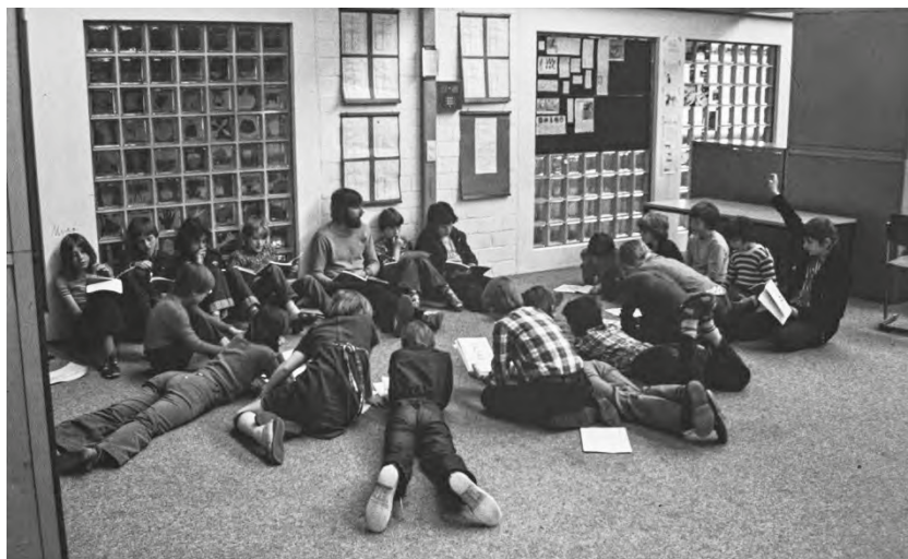
Abb. 1: Eine Lerngruppe auf einem „Wich“ des Haus 2 im Jahr 1977.

Wie müssen wir uns vor diesem Hintergrund denn deinen ganz konkreten pädagogischen Alltag in deinem ersten Laborschuljahr vorstellen? Hattest du das Gefühl, hier tatsächlich diejenigen reformpädagogischen Ansätze verwirklichen zu können, von denen du eingangs bereits bezogen auf deine vorangegangenen Tätigkeiten als Lehrer gesprochen hattest?