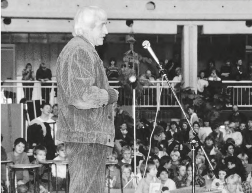
Abb. 1: Theodor Schulze 1987 bei der Verabschiedung Hartmut von Hentigs als Wissenschaftlicher Leiter der Laborschule. Foto: Willi Knoop; Quelle: Universitätsarchiv Bielefeld, SPM-I 1451-36.

zugleich zu egalitär, weil in ihrem Aufnahmeschlüssel und in der Beurteilung der Schüler auf Auswahl und Auslese verzichtet wurde. Aber auch die Vertreter der SPD betrachteten das Konzept der Schulprojekte mit Skepsis. Ihnen erschien es zu singulär und exklusiv. Sie bevorzugten das Programm der Gesamtschulen.