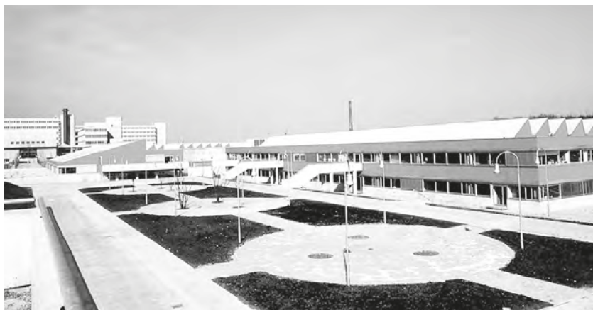
Abb. 1: Die Gebäude der Laborschule und ihr Außengelände 1974 kurz nach Eröffnung der Schule. FOS 00130.

Aber ins „kalte Wasser“ wurde ich an einer Stelle wirklich gestoßen. Wir mussten im Haus 1 den Schulbeginn ja auf den unterschiedlichsten Ebenen ganz praktisch vorbereiten und ich bekam den Auftrag, die tägliche Route für den Schulbus zu planen. Die Kinder wohnten ja über das ganze Stadtgebiet verstreut und mussten einzeln vor oder in der Nähe ihrer Wohnungen abgeholt werden. Und ich war gerade erst nach Bielefeld gezogen und sollte schon eine optimale Fahrtroute entwickeln! Eigentlich eine Zumutung! Es war zeitaufwendig und schwierig, weil ich die Stadt ja überhaupt nicht kannte, aber ich machte mich natürlich an die Arbeit, legte auch einen Plan vor, der tauglich schien, und lernte dabei die Stadt wirklich ziemlich gut kennen mit ihren sehr unterschiedlich gearteten Stadtvierteln. Woher unsere „Unterschichtkinder“ und unsere „Oberschichtkinder“ kamen, hatte ich danach deutlich vor Augen.