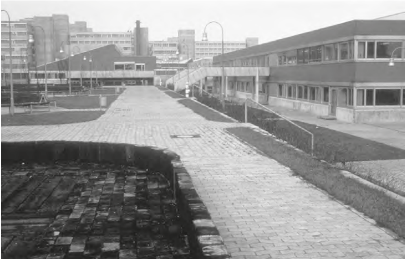
Abb. 2: Die Außenanlagen der Laborschule Mitte der 1970er Jahre.

sie in die Werkstatt, mein Sohn sah das, andere Tür raus, und weg war er. Dann beschwerte die Lehrerin sich bei mir, dass mein Sohn nie da wäre. Darauf sagte ich: „Wissen Sie was, mein Sohn ist um halb 8 hier. Wenn Sie dann auch da sind und den Unterricht anfangen, ist mein Sohn auch da. Der ist ganz enttäuscht, dass er kein Englisch, Rechnen, Schreiben, Lesen lernt. Sie sind ja nie da. Seien Sie mal da, dann ist mein Sohn auch da.“ Da hatte ich ja wieder was gesagt! Schwupp, weg war sie, hat sich nie wieder bei mir beschwert.