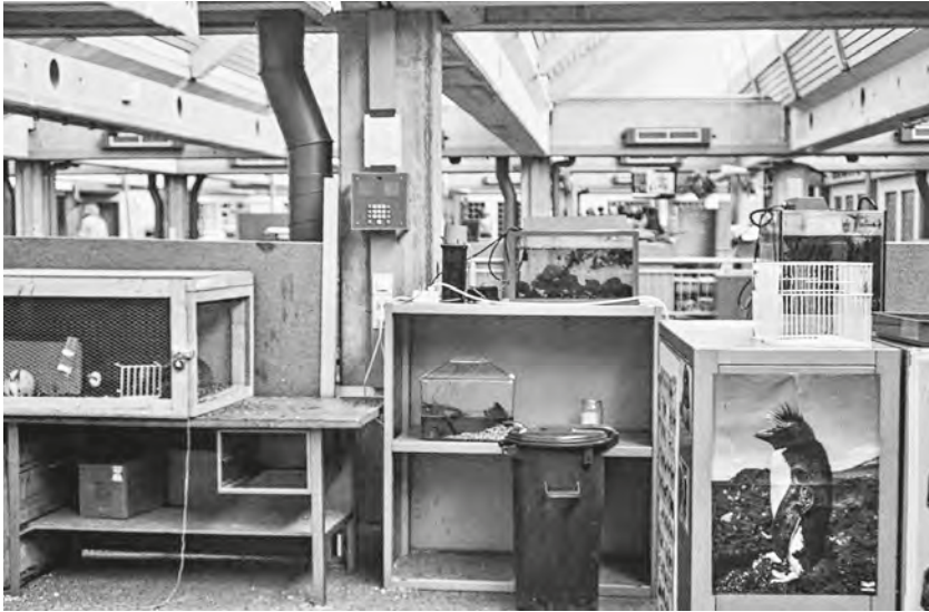
Abb. 5: Blick vom Schulzoo in den Großraum des Haus 2 im Sommer 1977.

für Semesterarbeiten geht. Ich kommentiere abschließend: In beiden Bereichen, in der Bibliothek wie auch in der Werkstatt, wird Laborschulpädagogik sehr erfolgreich „betrieben“. Das fällt in den Anfangsjahren gerade deshalb auf, weil andere Großraum-Bereiche noch nach pädagogischen Lösungen suchen (s.o.).